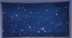
der Weltraum / das Weltall uzay