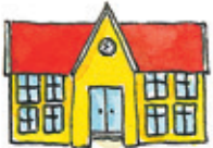
die Schule okul