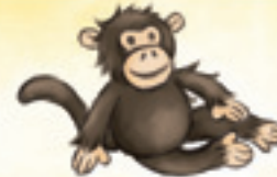
der Affe القرد