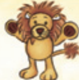
der Löwe الأسد