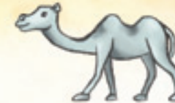
das Kamel الجمال