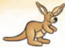
das Känguru الكنغر