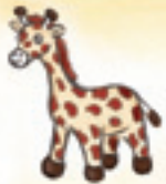
die Giraffe الزرافة