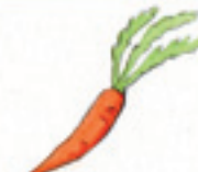
die Karotte هویج