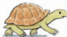
die Schildkröte لاکپشت