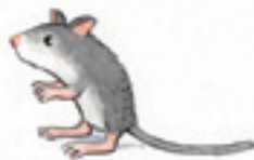
die Wüstenrennmaus موش