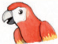
der Papagei طوطی