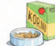
das Körnerfutter دانه‌های خوراکی