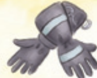
die Schutzhandschuhe (pl.)