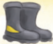
die Stiefel (pl.)