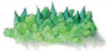
der Wald las