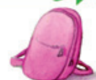
der Rucksack plecak