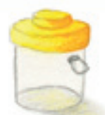
die Becherlupe kubek z lupą