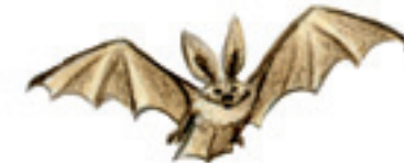
die Fledermaus летучая мышь