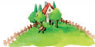
der Garten сад