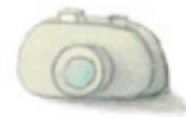
die Kamera камера