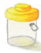
die Becherlupe стаканчик с лупой