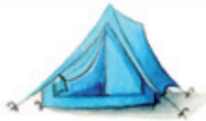
das Zelt палатка