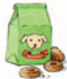
die Hunde-Kekse las galletas para perros