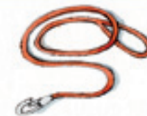
die Hundeleine la correa