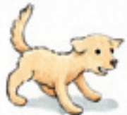
der Hund el perro