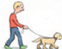
Gassi gehen sacar al perro