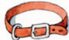
das Halsband el collar