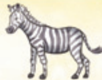
das Zebra zebra