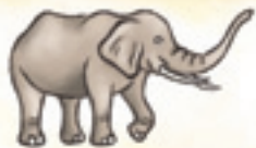
der Elefant elefantul