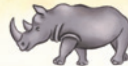
das Nashorn rinocerul