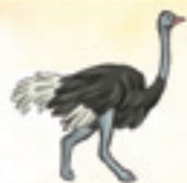
der Strauß struțul