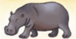
das Nilferd hipopotamul