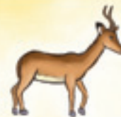
die Antilope antilopa