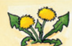
der Löwenzahn አቲ ስኒ-አንበሳ ጻህያይ