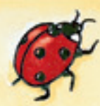
der Marienkäfer ሕንዚዝ ማርያም