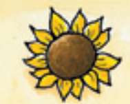
die Sonnenblume አታ ናይ ሱፍ ፍዮሪ