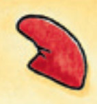
die Mütze አታ ቆቢዕ