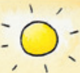
die Sonne አታ ጸሓይ