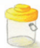
die Becherlupe paharul cu lupă