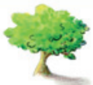
der Baum copacul