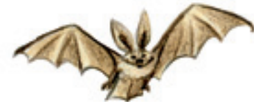
die Fledermaus liliacul