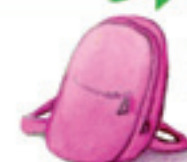
der Rucksack rucsacul