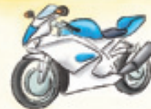
das Motorrad motorcycle