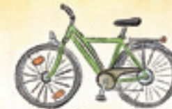
das Fahrrad bicycle/bike