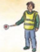
der Verkehrshelfer crossing guard