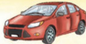
das Auto car