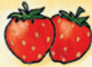
die Erdbeeren tûerd