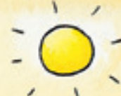
die Sonne roj