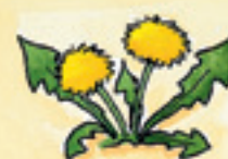
der Löwenzahn xêlfîzer