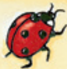
der Marienkäfer xalxalok