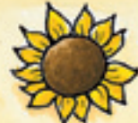
die Sonnenblume gulberoj