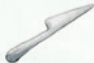
das Messer knife