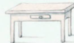
der Küchentisch kitchen table