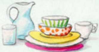
das Geschirr dishes