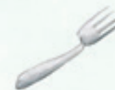
die Gabel fork