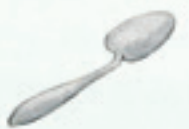
der Löffel spoon