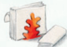
die Serviette napkin