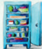
der Schrank cupboard