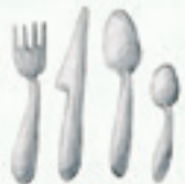
das Besteck silverware