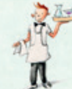
der Kellner waiter