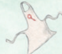
die Schürze apron