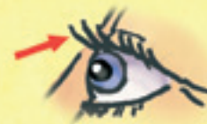
die Wimpern eyelashes