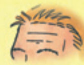
die Stirn forehead