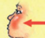
die Wange cheek