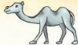
das Kamel እታ ገመል