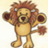
der Löwe እቲ ኣንበሳ