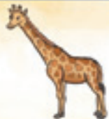
die Giraffe жираф