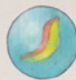
die Murmel la bilia