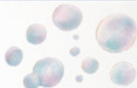
die Seifenblasen le bolle di sapone