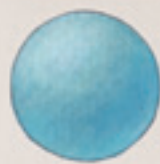
die Kugel la sfera