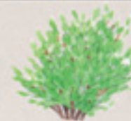
der Strauch il cespuglio