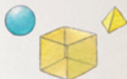
die Körper i solidi