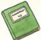
das Klassenbuch pirtûka polê