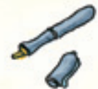
der Füller qelemximav