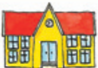
die Schule dibistan