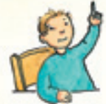
sich melden destê xwe hildan