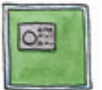
das Schließfach sindoq