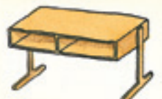
der Schreibtisch mase