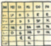
der Stundenplan plana polê