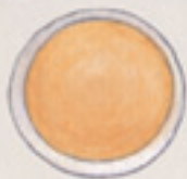
der Pfannkuchen блин