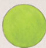
der Kreis круг