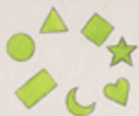
die Formen формы