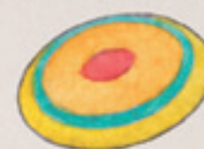
die Frisbee-Scheibe фрисби-диск