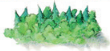
der Wald forest