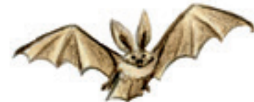
die Fledermaus bat