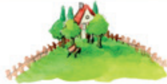
der Garten yard