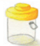
die Becherlupe bug viewer