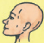
der Kopf capul