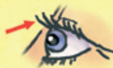
die Wimpern genele