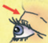
das Lid pleoapa