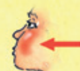
die Wange obrazul