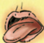
die Zunge limba