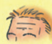
die Stirn fruntea