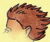
die Haare părul