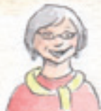
die Oma babcia