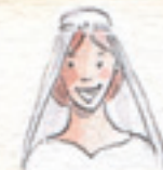
die Braut panna młoda