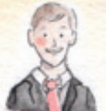
der Bräutigam pan młody