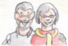
die Großeltern dziadkowie