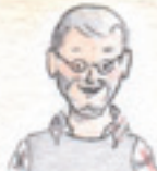
der Opa dziadek