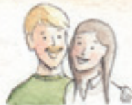
die Eltern rodzice