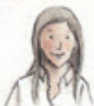
die Mama mama