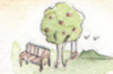
der Garten ogród