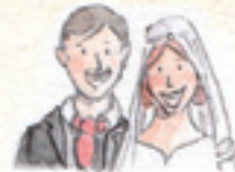
das Hochzeitspaar para młoda