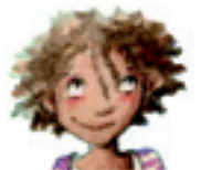
das Augenverdrehen badana çavan