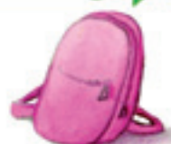
der Rucksack çente