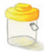
die Becherlupe qotîka zirebînê