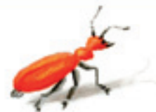
der Käfer kêzik