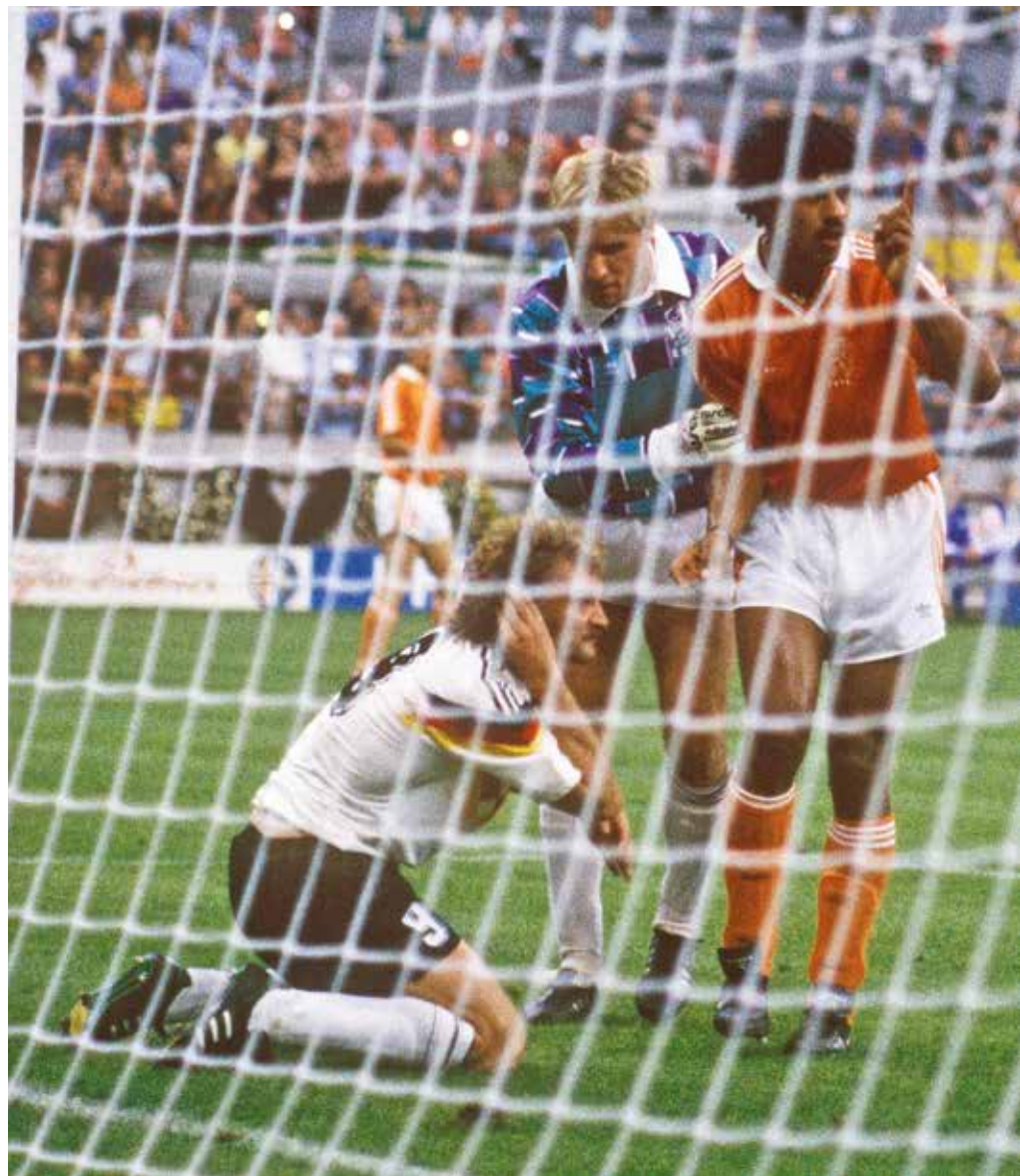
Unmittelbar nach dem Zusammenprall zwischen Rudi Völler und Torwart Hans van Breukelen eskaliert der Zoff mit Frank Rijkaard, beide fliegen vom Platz.

haften. Rudi Völler war damals dabei gewesen und sagte nun: „So was vergesse ich nicht. Es wäre nichts schöner, als die Holländer nach Hause zu schicken.“ Aber gegen sie hatte es seit drei Spielen keinen Sieg gegeben, in der WM-Qualifikation landeten die