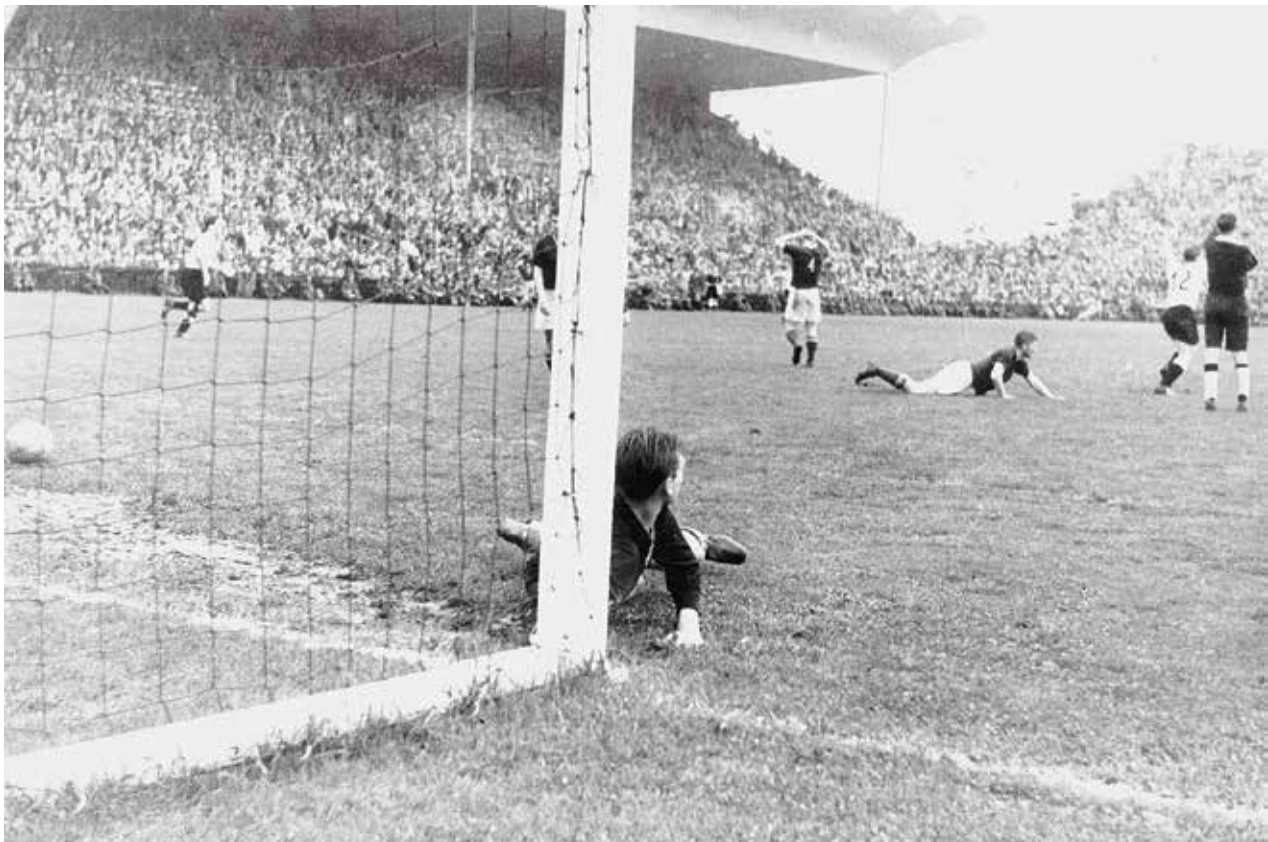
Sekundenbruchteile nach dem berühmtesten Tor deutscher Fußballgeschichte: Ungarns Torwart Grosics liegt am Boden, aus dem Hintergrund hat Helmut Rahn (Nr. 12) geschossen – 3:2.

Im Hotel Belvedere traf wieder haufenweise Post ein, längst hatte sie einen anderen Zungenschlag und der „Mitarbeiter“ aus Säkingen, der Herberger nach dem 3:8 am liebsten hatte baumeln sehen, ging nach Canossa. Er war Augenzeuge des 6:1 und nun gingen ihm auch die Augen auf: „Jetzt habe ich aber doch gesehen, dass Sie mit ihrer Einstellung recht hatten und ich beglückwünsche Sie zu Ihrer Haltung und Ihrer Mannschaft ... Die Vorwürfe nehme ich also mit Bedauern zurück.“