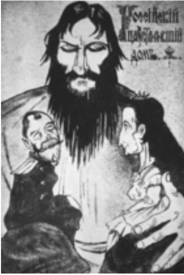
Rasputin, der Zar und die Zarin.