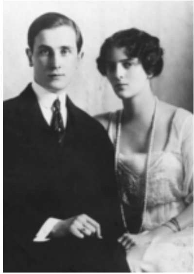
Fürst und Fürstin Jussupow.

mit vergifteten Kuchen und mehreren Revolverschüssen –, sowie die Tatsache, dass sie seinen riesigen Körper schließlich durch ein Eisloch unter einer Brücke entsorgt hatten, so dass er zwei Tage lang nicht gefunden worden war.