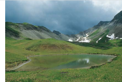
Gouille des Fours.

Ausgangspunkt: Parking de Cochenet (976 m) in Cordon. In Sallanches Richtung Cordon. Dort an der Kirche nach 500 m rechts. Nach weiteren 1,3 km nochmals rechts (schmuckes Holzschild »Pont de la Flée«) und 0,9 km auf geteilter Straße bis zum (kleineren) Parkplatz.