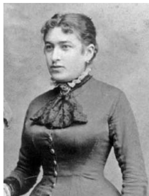
Tochter eines Bierbrauers: Kafkas Mutter Julie, geborene Löwy (1856-1934)