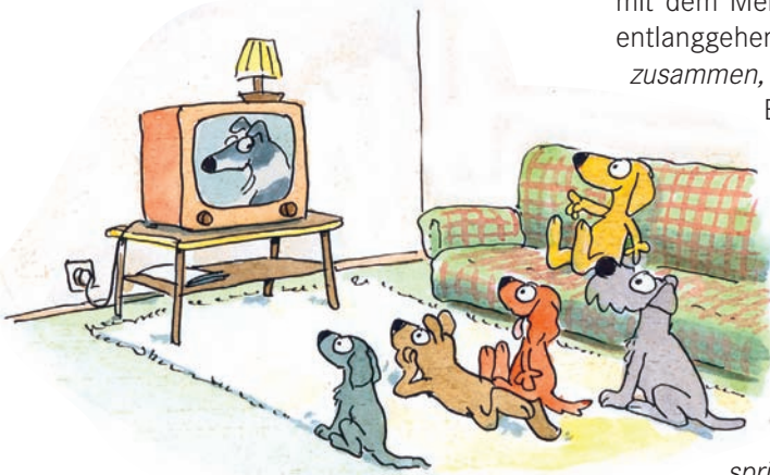
Lassie, das Vorbild aller Hunde?

Eichhörnchen ignorieren, das vor meiner Nase quer über den Weg flitzt? Warum um alles in der Welt sollte ich das tun? Hinsetzen, wenn Besucher an der Haustür klingeln? Wie unhöflich! Höfliche Hunde begrüßen einander, indem sie sich gegenseitig die Leffen lecken! Ein guter Hund muss also nach oben springen, um diese un bequem hoch angebrachten Münder küssen zu können.