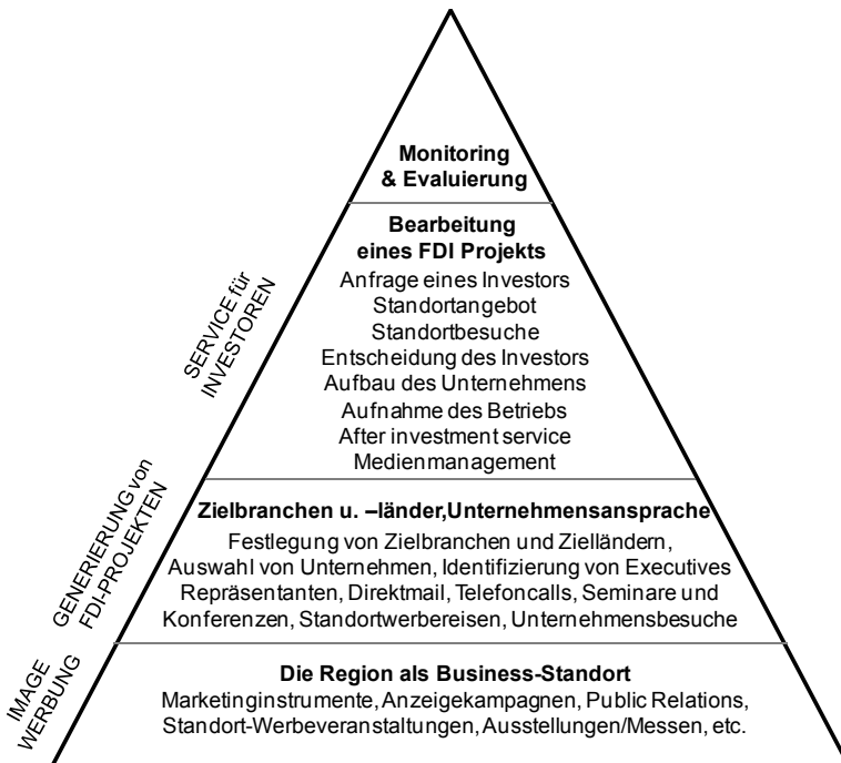
Abbildung 1: Standortwerbung und Unternehmensansiedlung

Ganz gleich, um welchen Standort es sich handelt, ein Bundesland, eine kleinere Region, eine Kommune oder ein privates Gewerbegebiet: um heute erfolgreich Investitionen zu akquirieren und Unternehmen anzusiedeln, bedarf es hoher Professionalität. Es reicht nicht mehr, ein hinsichtlich Kosten und Infrastruktur attraktives Angebot abzugeben, das können viele. Gewinner wird der Anbieter oder die Wirtschaftsförderung sein mit der größten Kundenorientierung und Professionalität. Allein aus Studien und Lehrbüchern ist das nicht zu erlangen.