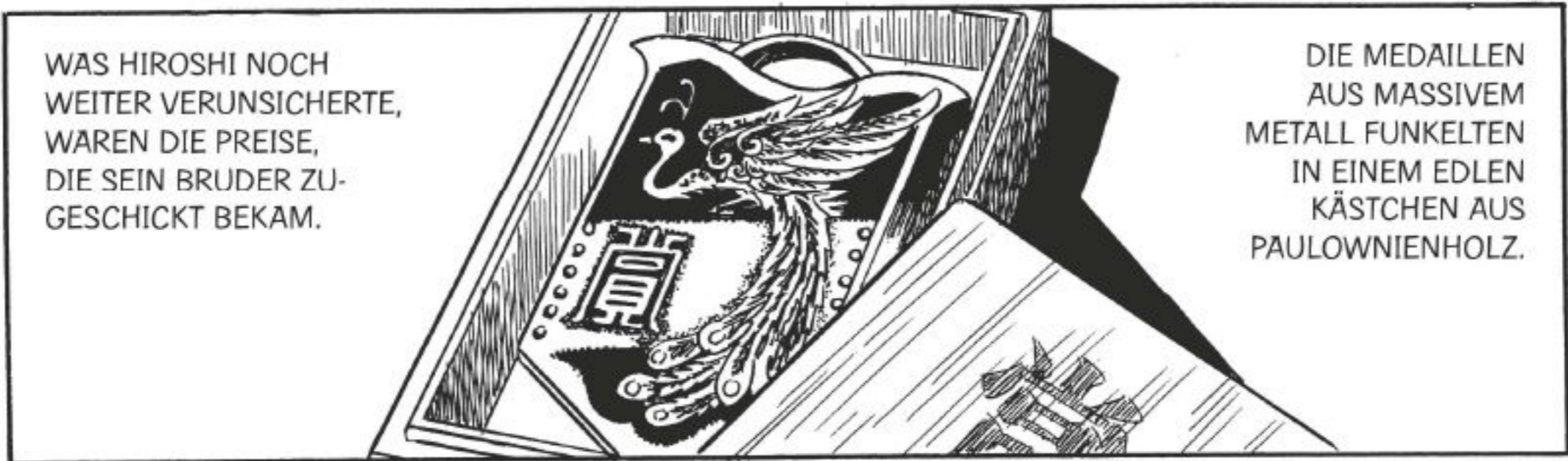
Manga Shonen, März 1949