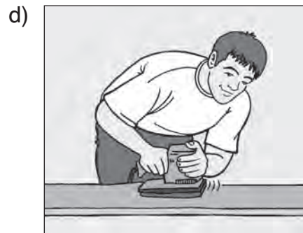
Holz mit einem Schleifgerät