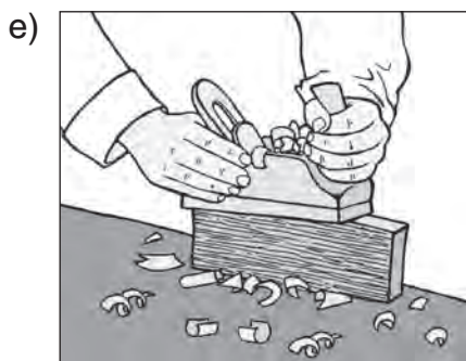
Holz mit dem Hobel