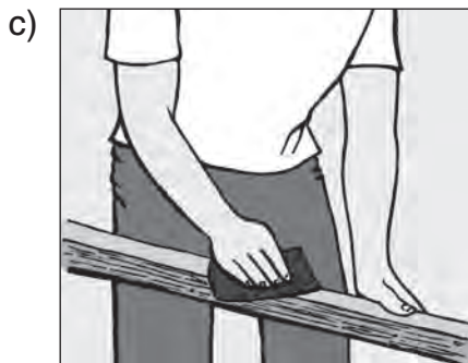
Holz mit Schmirgelpapier