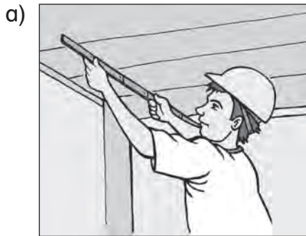
etwas mit dem Zollstock

schleifen ♦ hobeln ♦ feilen ♦ ausmessen ♦ schmirgeln ♦ sägen