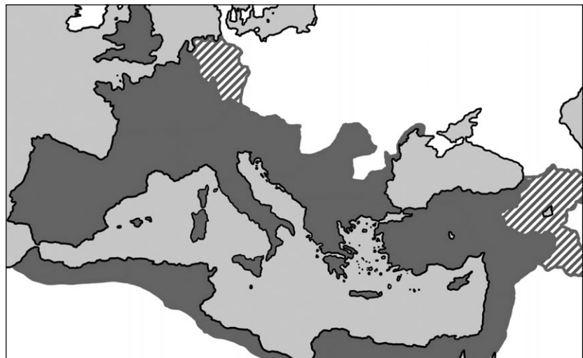
Das Römische Reich 117 n. Chr. (im Maßstab 1,5 cm = 500 km)