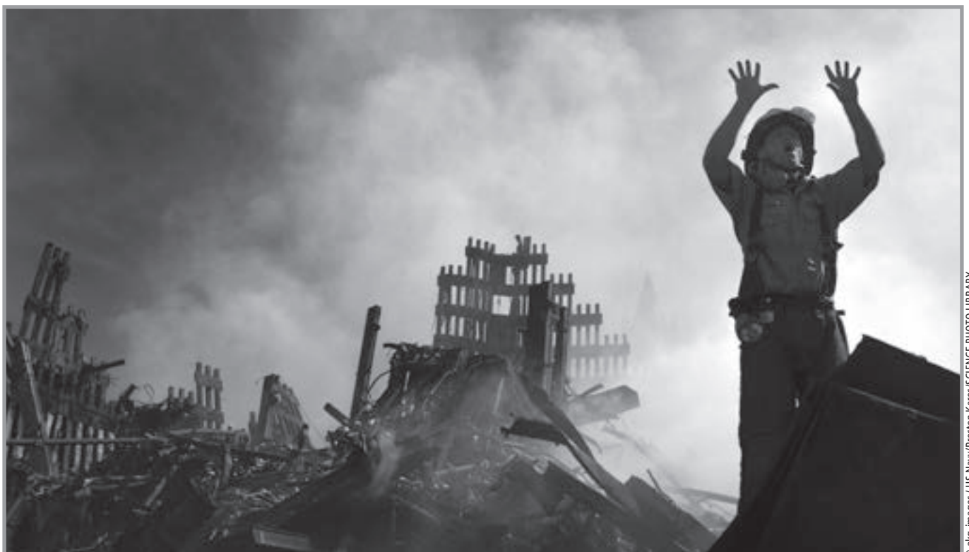
Ein New Yorker Feuerwehrmann fordert am World Trade Center weitere Hilfe an.

(Quelle: Bernd Flessner: Sagenhafte Helden. Entdecker, Revolutionäre, Freiheitskämpfer und andere Helden. Beltz & Gelberg 2009, S. 164ff.)