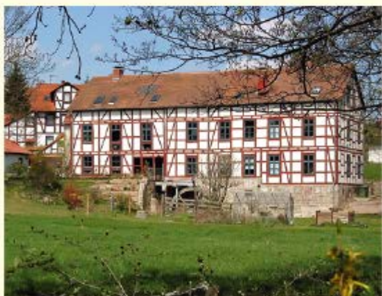
Die Obermühle von Vellmar ist heute zum Privathaus umgebaut.

Stelle kann damit als die Waldschmiede identifiziert werden, die in einer Urkunde des Jahres 1390 genannt ist. Sie ist eine der ältesten in Hessen. Das verwendete Eisenerz, das zu Roheisen verhüttet wurde, stammte vermutlich von Abbaufeldern im Habichtswald.