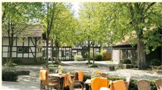
Das Fachwerkensemble im Ahnepark ist nicht nur im Sommer ein beliebter Treffpunkt.

Hinter der Eisenbahnbrücke verlässt man für ein kurzes Stück den Bachlauf. Auf geteertem Weg durch Wiesengrundstücke erreicht man den alten Ortskern von Obervellmar und passiert den Hof Helse, das Heimatmuseum der Stadt