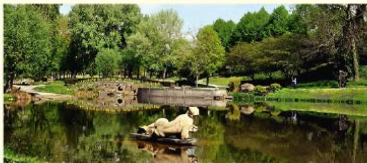
Der Ahnepark hat sich zu einem attraktiven Freizeitpark für alle Bürger im Norden Kassels und im Landkreis entwickelt.

Lärmschutz gegen den Verkehr der benachbarten Bundesstraße. Die Uferbereiche und Flachwasserzonen begrünen Schilf, Binsen, Pfeilkraut, Seerosen und viele weitere Wasserpflanzen. Im Zusammenspiel mit vielen tausend Blumen ergeben sich das ganze Jahr über reizvolle Farbenspiele im Park.