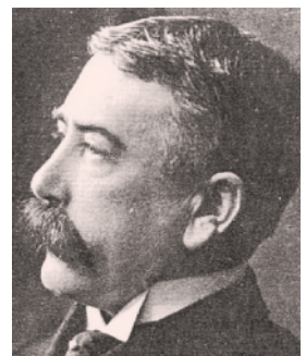
Ferdinand de Saussure

Die langue als abstraktes System der Sprache: Der Unterschied zwischen Sprache im Allgemeinen und Sprache im Besonderen lässt sich gut an den französischen Wörtern langue und langage erklären: Während Il a été critiqué pour sa langue von jemandem gesagt werden kann, der die falsche Sprache wählt (z. B. Englisch statt Französisch), wäre Il a été critiqué pour son langage angebracht, wenn der Sprecher zu um-