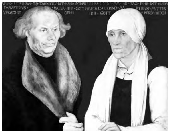
Hans und Margarethe Luther

Im Alter von 14 Jahren kam Martin auf eine Schule in Magdeburg. In dieser Schule mussten alle Kinder Latein sprechen. Es gingen nur Jungen zur Schule. Die Mädchen mussten den Müttern im Haushalt helfen. Luther war ein sehr fleißiger und guter Schüler. Er lernte schnell, aber er hatte viele Ängste. Er hatte z. B. Angst vor seinem Lehrer, da dieser sehr streng war. Es kam des Öfteren vor, dass der Lehrer die Schüler mit einem Stock schlug.