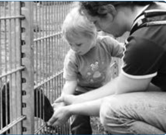
Abb. 1.1: Eltern möchten die Wahl haben, wie lange sie ihre Kinder selbst betreuen

Mit dem Ausbau der Betreuungsangebote für Kinder in den ersten drei Lebensjahren wird individuellen Interessen von Familien und gesellschaftlichen Bedürfnissen gleichzeitig entsprochen. Eltern möchten die Wahl haben, wie lange sie ihre Kinder selbst betreuen oder wann sie wieder arbeiten gehen. Die Gesellschaft hat ein Interesse daran, dass zum einen mehr Kinder geboren werden und somit ihre Zukunft ge-