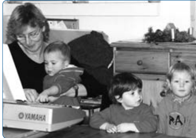
Abb. 1.2: Gute Krippenarbeit braucht eine gute Fachkraft-Kind-Relation

Dies ist nun eine ernstzunehmende Einzelbeobachtung, doch was haben größere Studien herausgefunden?