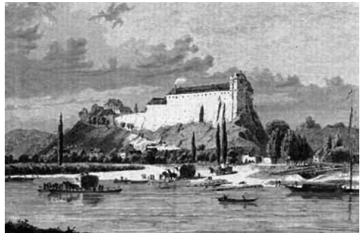
Die Stammburg des Hauses Wettin an der Saale, nördlich von Halle.

Dieses Fürstengeschlecht, wohl kleinen schwäbischen Grundherren entstammend, kann auf eine in der deutschen Geschichte beispiellose Entwicklung verweisen. Die Wettiner wurden zu Markgrafen und Kurfürsten, sie erwarben die Krone von Polen und wurden zu Königen von Sachsen. Sie stellten zwei kleinen Königreichen (Belgien und Bulgarien) die Regenten und gaben dem britischen Weltreich die Dynastie. Die Wettiner waren keine großen Eroberer und überfielen nicht ihre Nachbarn. Doch sie erkannten ihre Möglichkeiten und nutzten diese dann meist konsequent. Ebenso