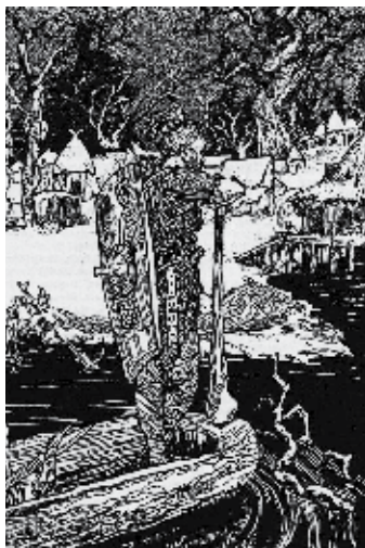
Am Fischerdorf Lipzk, um das Jahr 900.

Dort gründeten slawische Stämme, wahrscheinlich Sorben, ein Dörfchen mit dem Namen Lipzk, worin in ihrem Sprachgebrauch das Wort lipa enthalten ist, das Linde bedeutet. Ort bei den Linden. Die Leipziger haben seit alter Zeit ein besonderes Verhältnis zu dem schönen Baum ihrer Heimat und hören es nicht ungern, wenn man von der „Lindenstadt“ spricht.