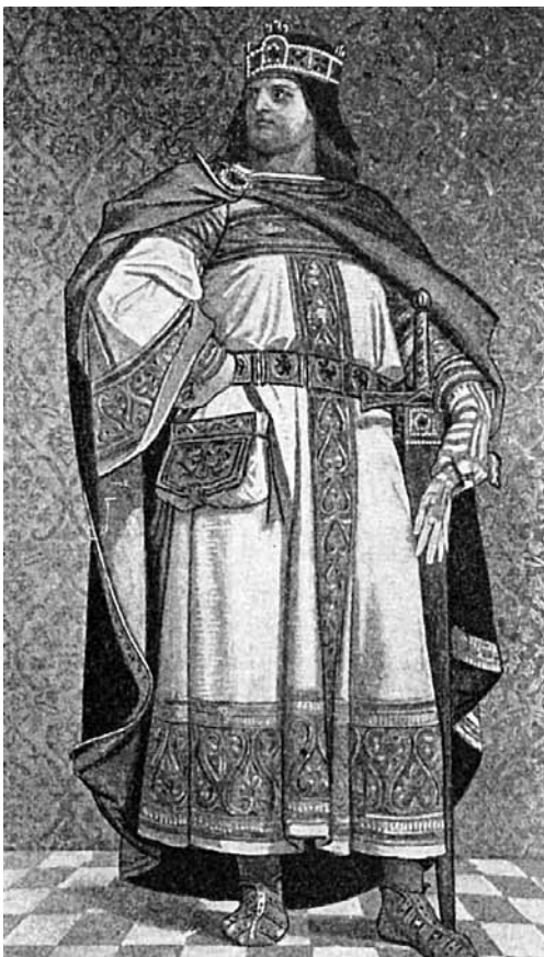
Markgraf Otto der Reiche.

Zeit Leipzigs drittes Gotteshaus, die Peterskirche. An den kleinen turmlosen Bau erinnert noch heute der Straßename „Peterskirchhof“. Es ist anzunehmen, dass zu dieser Zeit auch die Nikolaikirche bereits im Bau gewesen ist oder sogar schon fertiggestellt war. Aufzeichnungen über ihre Erbauung sind nicht vorhanden.