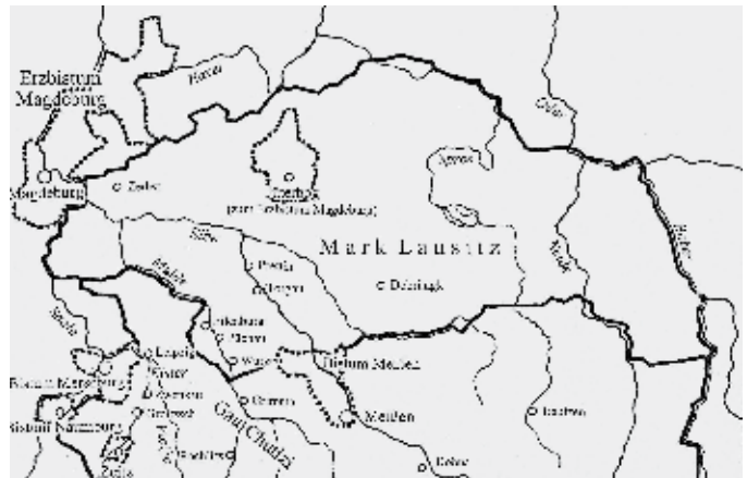
Politische Übersicht des mitteldeutschen Landes um das Jahr 1000.

Kaiser Heinrich II. machte sie dem von ihm hochverehrten Bischof Thietmar von Merseburg zum Geschenk. Dieser Umstand lässt den Rückschluss