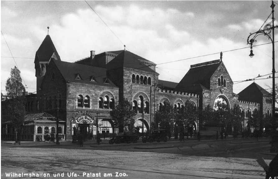
»Wilhelmshallen und Ufa-Palast am Zoo«, Berlin, Außenansicht, zeitgenössische Postkarte, undatiert, vor 1945