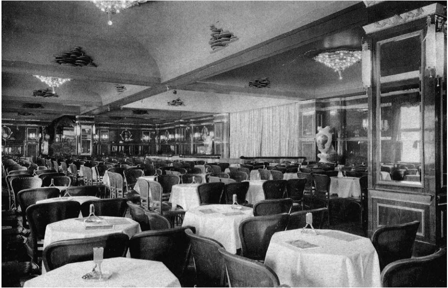
»Varieté und Kabarett Wilhelmshallen am Zoo«, Berlin, Innenansicht, zeitgenössische Postkarte, undatiert, vor 1945

Kellner auf einem Ausflugsdampfer auf dem Rhein. Nach seiner Rückkehr nach Berlin arbeitete er als Kellner im Karl-Liebnecht-Haus 26 , in dem seit 1926 neben dem Zentralkomitee (ZK) der KPD und der KPD-Bezirksleitung Berlin-Brandenburg die Redaktion der Parteizeitung »Rote Fahne« mit Druckerei sowie eine Buchhandlung untergebracht waren. 27 In dieser Zeit lernte Willi Engels viele leitende Funktionäre des ZK der KPD kennen. Einige von ihnen sollte er später in den verschiedenen Haftanstalten, Konzentrationslagern oder auch in den Reihen der Spanienkämpfer wieder treffen. »An ungedeckten hölzernen Tischen wurden die Mahlzeiten eingenommen. Eine Speisekarte gab es nicht, da es meist nur ein Gericht mit kleinem Nachttisch gab. Ob Ernst Thälmann, Walter Ulbricht, der Rot-Frontkämpfer-Funktionär Willi Leow oder Arthur Golke, der Wirtschaftsleiter des Karl-Liebnecht-Hauses, alle nahmen die selbe Mahlzeit ein.« 28 Auch hier, in der Kantine des ZK-Gebäudes, wurde Willi Engels zum Vertrauensmann der Belegschaft gewählt.