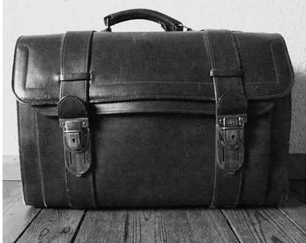
Die Aktentasche, in der Willi Engels seine Unterlagen aufbewahrte, Aufnahme 2016