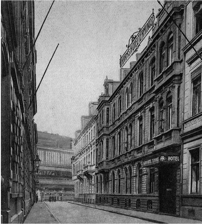
Außenansicht des »Harms Hotel Terminus« (rechts) in Köln, zeitgenössische Postkarte, un- datiert, vor 1945