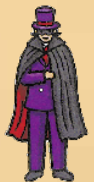
Mr X Der Phantomdieb