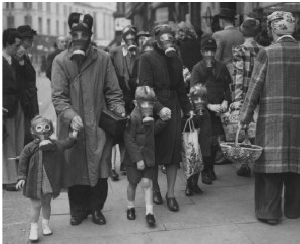
LINKE SEITE Mehr als eine Million Wohnungen wurden während des Kriegs in London zerstört oder beschädigt. OBEN Gasmaskenübung im Londoner Stadtteil Richmond 1941.

»Das Einzige, was man durfte, war die Klappe halten«, sagte Pete. Aber die Klappe halten war wohl das Einzige, wozu The Who nicht bereit waren. Sie machten sich daran, einer Generation Gehör zu verschaffen, zuletzt ohrenbetäubend laut.