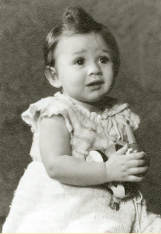
Mama, wo bist du?