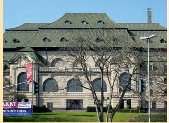
Historische Gebäude aus Wickrath, Mönchengladbach, und Rheydt.