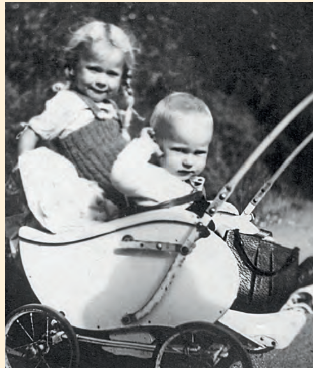
Ein Kinderwagen für alle!