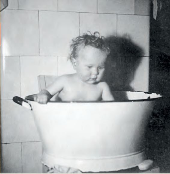
So ein Wonneproppen!