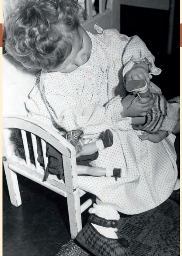
Mein Thron, meine Puppe und ich.