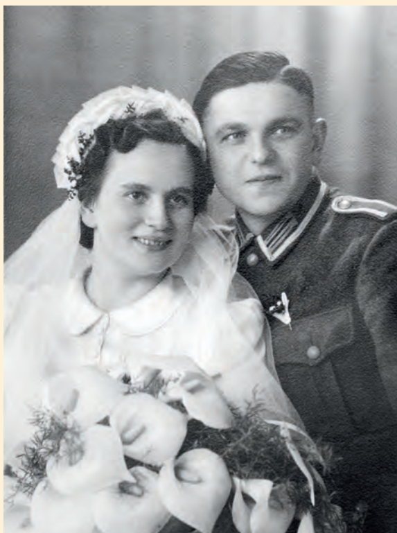
Hochzeit im Krieg.

Den Kindern wurde unermüdlich eingetrichtert, dass der böse Feind bekämpft werden müsse.