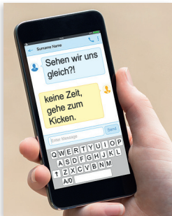
Sender und Empfänger