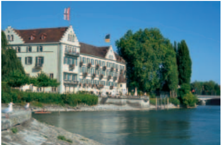
Unten: Das Insel-Hotel, ein ehemaliges Dominikaner-Kloster neben dem Stadtgarten

Da sich im Konstanzer Süden das schweizerische Kreuzlingen anschließt, erweiterte sich Konstanz Richtung Norden mit neueren Vororten auf der rechten Rheinseite. Mehrere Brücken verbinden die Konstanzer Stadtteile.