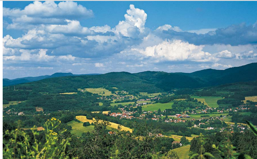
Weit blicken wir über den Talkessel von Ban-de-Laveline.