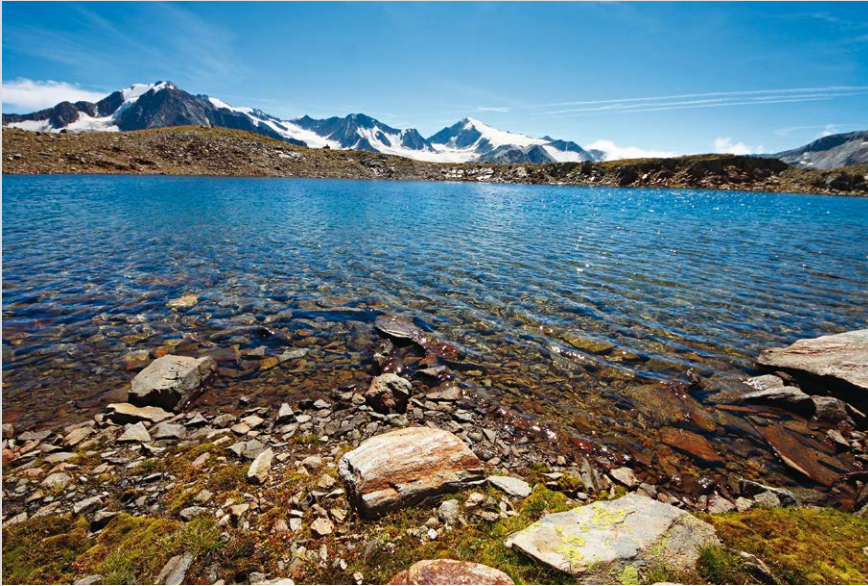
Der Samoarsee lockt bei einer Extratour auf die Kreuzspitze.

Wie lässt sich ein Hüttentrek in diesen hochalpinen Gefilden nun am besten anlegen? Eines vorweg: Den Gletschern können wir ohne große Probleme ausweichen. Zwar ließe sich selbstverständlich auch eine veritable »Haute Route« über Gletscher und Gipfel zusammenstellen, was im Rahmen eines Wanderführers jedoch nicht die Intention sein kann. Bezüglich der Richtung sei keine eindeutige Empfehlung ausgesprochen, aber ein hoch gelegener Start am Tiefenbachferner oberhalb von Sölden ist sicher nicht die schlechteste Idee. Damit geht es gleich über einen ausschweifenden Panoramaweg Richtung Breslauer Hütte, die sonst normalerweise direkt von Vent angelaufen wird. Vernaghütte und Hochjochospiz heißen anschließend die nächsten Kettenglieder, womit wir schon in den Bereich des hinteren Rofentals vorstoßen. Die Anforderungen bleiben bis dorthin noch sehr moderat, es sei denn man schaltet schon mal einen Dreitausender ein, etwa die Guslarspitzen. Doch dies ändert sich, wenn wir von den weitläufigen Flanken des Weißkamms abrücken und am Saykogel einen hohen Übergang am Kreuzkamm aufs Korn nehmen. Mit der bekannten Kreuzspitze als Kulminationspunkt kann man von der Martin-Busch-Hütte eine lohnende Extratour einflechten. Die nächste große Hürde stellt sich uns danach am Ramolkamm entgegen, jenem mächtigen Gipfelzug, der sich massiv zwischen die Täler von Vent und Obergurgl schiebt. Über das