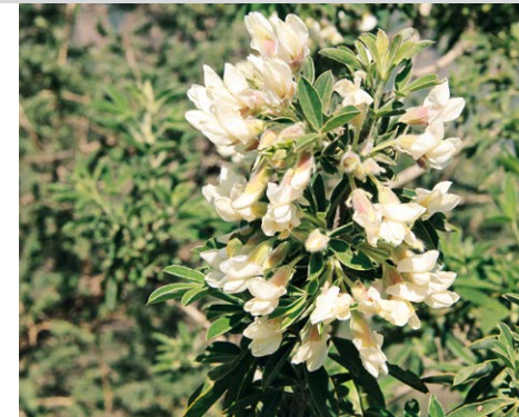
Blüte des Sprossenden Zwergginsters.

Grandios ist die Aussicht vom Roque de los Muchachos. Die 36 km lange Auffahrt beginnt nördlich von Santa Cruz in Mirca. Von dort windet sich eine Serpentinstraße zunächst durch dichten Baumheidebusch und Kiefernwald die Ostabdachung der Cumbre hinauf. Spätestens