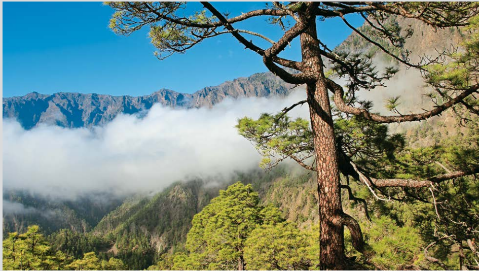
Die Caldera de Taburiente, gesehen von der Cumbrecita.