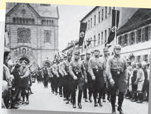
SA-Aufmarsch vor dem Speyerer Dom.

ämter in einer Hand vereinigt, sind binnen weniger Monate die Errungenschaften von 14 Jahren Demokratie zunichte gemacht.