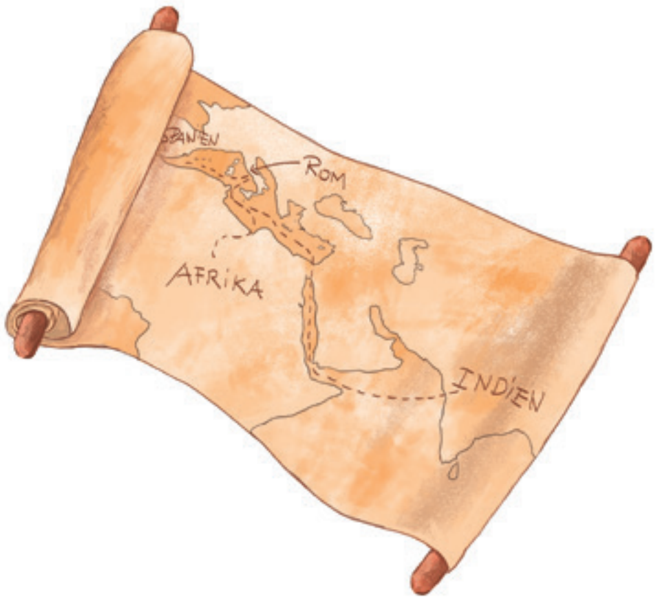
Die Wege von Titus' Gewürzhandel